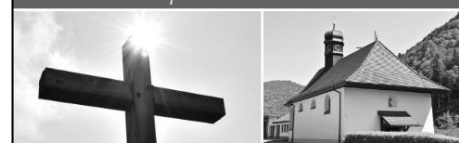
Katholische Kirche im Oberen Wiesental Schönau – Todtnau – Wieden – Todtnauberg – Geschwend

Donnerstag, 14. Mai 2026 – 09:00 Uhr Stadtkirche Mariä Himmelfahrt Schönau Hochamt mit anschließender Flurprozession zur Kapelle in Schönenbuchen